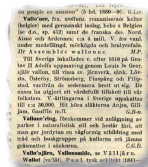
Svensk uppslagsbok, 1936

Till och från förs en debatt rörande egenkaps- och utseendemässiga särdrag hos dagens vallonättlingar. Det mesta av detta är fria fantasier. Efter så lång tid som 400 år finns för de allra flesta vallonättlingar inga typiska kännetecken kvar. Det enda undantaget kan vara de stora vallonbruken i Uppland, där valloninslaget var påfallande stort ända fram till bruksdöden i början av 1900-talet. Därifrån kan det fortfarande finnas individer med ett genetiskt inslag