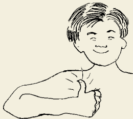
Illustration: Kristin Almers

Inom medicinsk forskning intresserar man sig bland annat för ärftliga sjukdomar. En del av dessa har så typiska symptom, exempelvis blödarsjuka och danssjuka, att de kan spåras bakåt med hjälp av släktforskning. Det finns en sjuklig förändring, som eventuellt kan hänföras till en viss bestämd vallonsläkt. Det handlar om Welanders Distala Myopati (WDM), som även kallas "Hedesundasjukan". I en lindrig form yttrar den sig i form av ett försvagat tumgrepp ("vallontumme"). WDM ärvs autosomalt dominant, det vill säga att om man har genen så får man WDM. Alla som har WDM är alltså släkt med varandra och har en gemensam anfader eller anmoder.