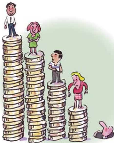
Kapitalvinster och ökade skillnader mellan dem som har och inte har arbete, förklarar stor del av de ökade inkomstskillnaderna.

Fram till början 1970-talet bestod invandringen till största delen av arbetskraftsinvandring från Norden. Sedan dess har invandringen ändrat karaktär. Den nordiska arbetskraftsinvandringen har nästan upphört och har ersatts med flyktinginvandring. Fram till 1990-talet var invandrare från Norden dominerande bland de utrikes födda i Sverige.