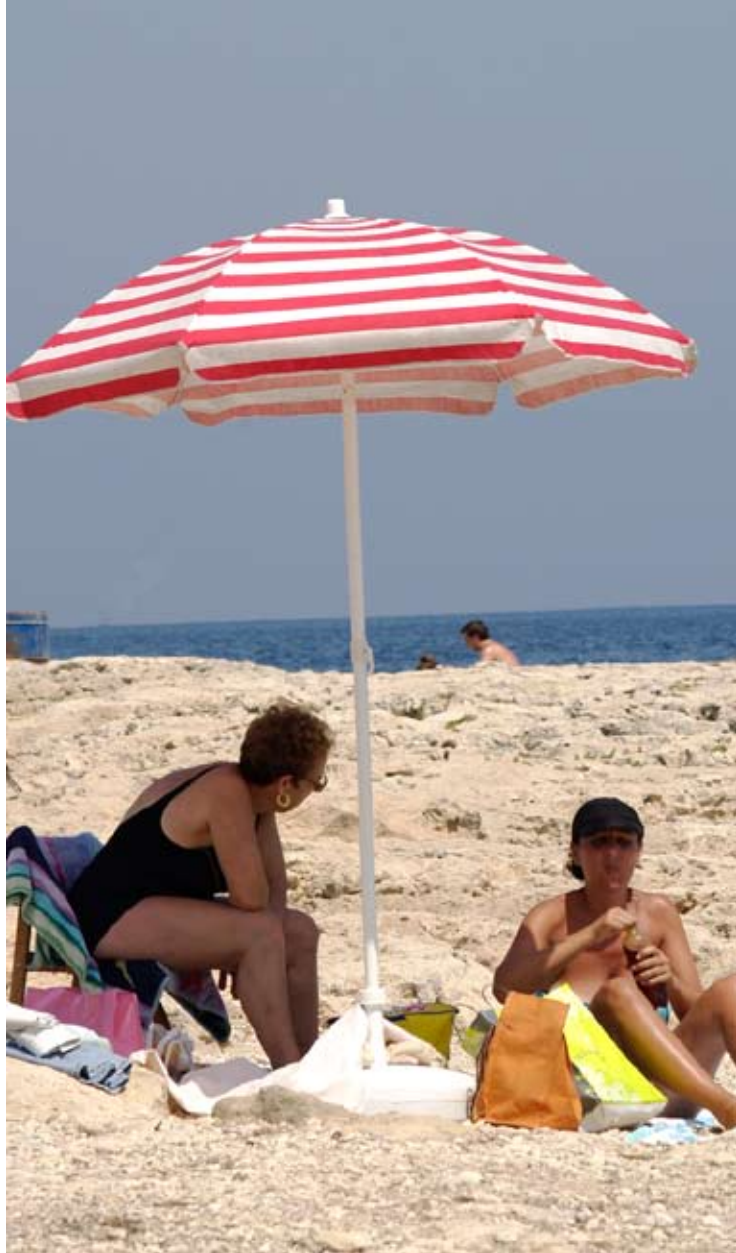
Alla som befinner sig utomlands är inte på semester.

är det drygt 10 000 fler kvinnor än män som lämnat landet.