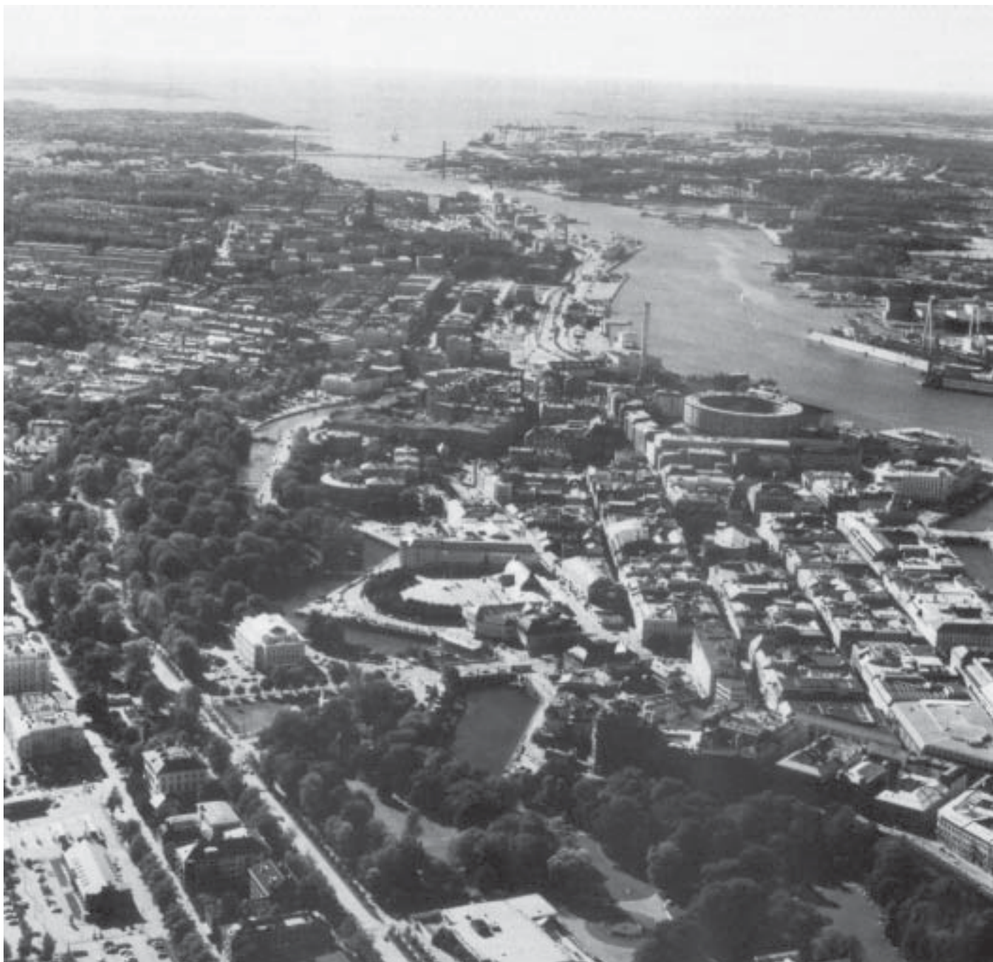
Centrala Göteborg med Vallgraven i förgrunden som bestående minne av 1600-talets försvarsanläggningar, hamnen i bakgrunden och längst bort mot havet Älvsborgsbron.

Ytterligare ett sätt att belysa skillnaden mellan den spridda bebyggelsen, den genuina glesbebyggelsen, och den agglomererade mer storstadspräglade bosättningen framstår i en inventering som nyligen gjorts vid SCB. Vi har där genomfört