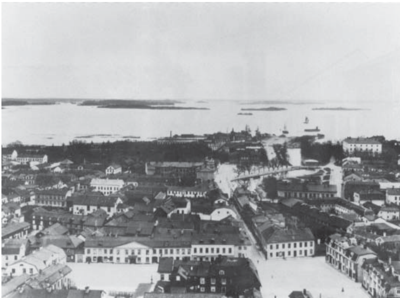
Västerås var ännu på 1890-talet en småstad med drygt 8 000 invånare.

Det sena 1800-talets bidrag till stadsplaneringen var, förutom den starka stadstillväxten, begränsat till införandet av träd-