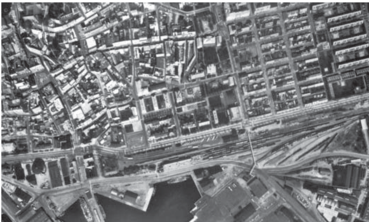
Denna flygbild över dagens Ystad visar tydligt på kontinuiteten i stadsplaneringen: medeltidsstaden i centrum, rutnätsplanen i öster och de ykrävande kommunikationsanläggningarna i hamnområdet. LMV.

Annars var 1800-talet som den fria liberalismens period den kanske minst reglerade bebyggelseepoken med spekulationsbyggen, tomtjobberi och kåkstäder, särskilt strax utanför stadsgränsen, som ett uttryck för en sida av tidsandan, om man ser till