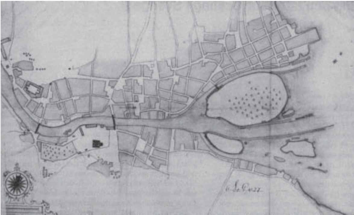
Den medeltida stadens karaktär och gatunät får här exemplifieras med N Tessin den äldres "uppmättningskarta" över Gävle från 1640-talet. Avsikten med denna karta var att den skulle utgöra grund för ett nytt reglerat stadsplaneförslag.