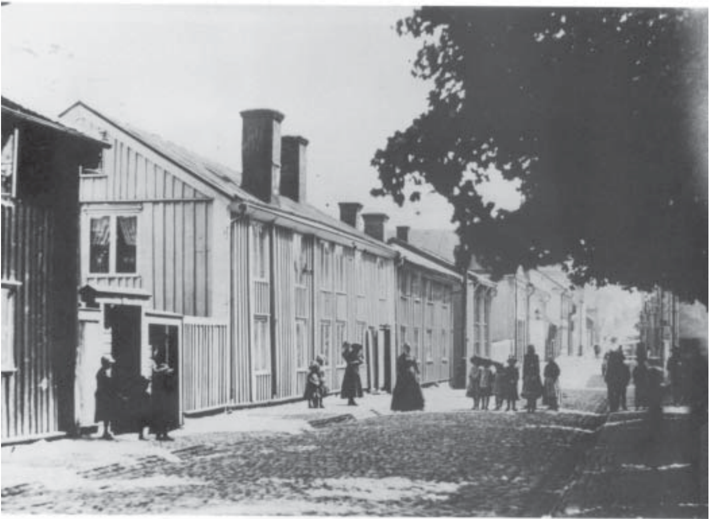
Den svenska trästaden med tvåvåningsbebyggelse och kullerstengsgator är en karakteristisk miljö för de mindre städer som undgått förödande bränder. Bilden är från Västervik mot slutet av 1800-talet, men speglar egentligen den förindustriella 1800-talsstaden. Arkitekturmuseet, Stockholm.

Med en annan innebörd i begreppet stadstyper skulle det också vara möjligt att beskriva städer efter deras funktion såsom huvudstad, administrationsstad, hamnstad, fästningsstad, industristad osv. Sådana indelningar har också gjorts, både av historiska städer och av de nuvarande. Även om denna typ av klassificering inte redovisas här, kan det vara bra att ha också en sådan karakteristik i minnet när 1800-talets och 1900-talets omfattande urbanisering skall beskrivas, inte minst därför att denna också omfattar en mängd småsamhällen med ibland mycket ensidiga funktioner som exempelvis fiskelägen, bondbyar, brukssamhällen, stationssamhällen, ensidiga industrier