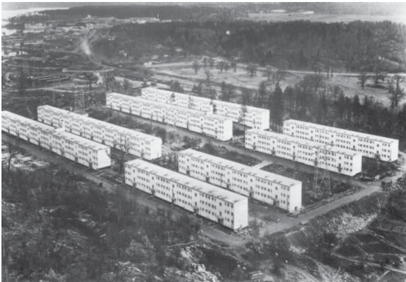
Stadsdelen Hjärtan i Stockholm får med sina smalhus från 1935–38 representera funktionalismens radikala nya stadsplaneideal. Arkitekturmuseet, Stockholm

medaljens baksida. Som en slags motström mot de osunda industristädernas bostadsmiljöer växte idén om Garden-cities, trädgårdsstäder, fram i England mot århundradets slut. De mest kända svenska exemplen på sådana villastäder är Djursholm och Saltsjöbaden, sedan dessa omkring 1890 fått spårvägsförbindelse med huvudstaden. En motsvarande förortsbebyggelse tillkom kring Göteborg och i mindre omfattning runt de medelstora städerna i landet.