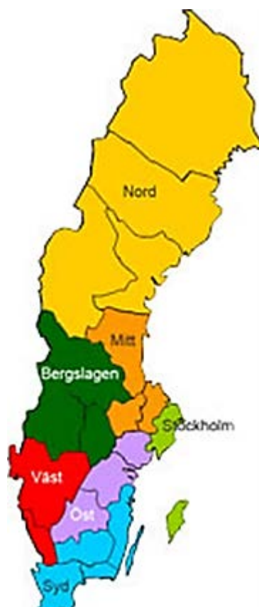
Länsindelning i de nya polisregionerna.