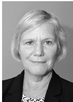
Ann-Marie Begler Försäkringskassan