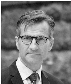
Erik Thedéen Finansinspektionen