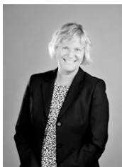
Ann-Marie Begler Försäkringskassan