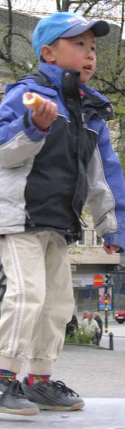
Sverige har tillsammans med Norge och Danmark den största andelen utlandsadopterade i världen.

I absoluta tal har Sverige tagit emot det näst största antalet barn av alla länder i världen. Bara USA har tagit emot fler barn för adoption. Som en parentes kan nämnas att det i USA oftast är ättlingar till de utvandrade skandinaverna som adopterar barn från utlandet.